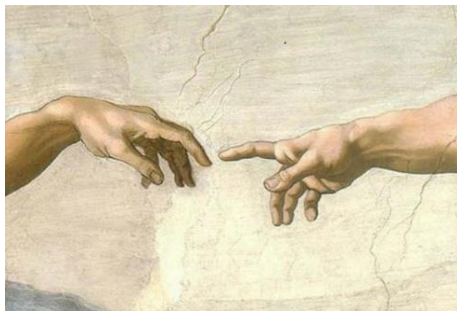
Michelangelo – De schepping van Adam (detail)